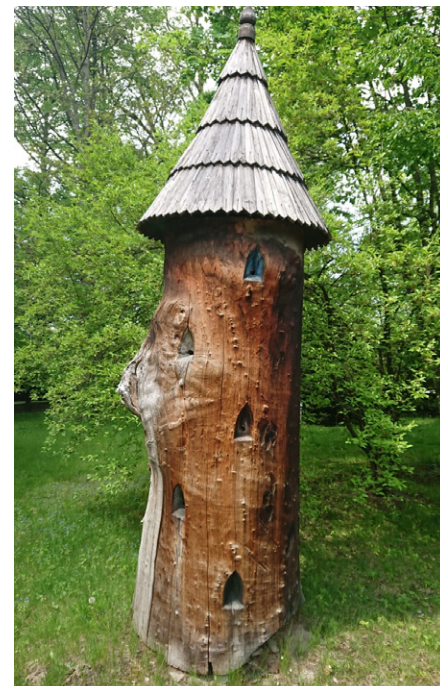
Typický starý „klát“