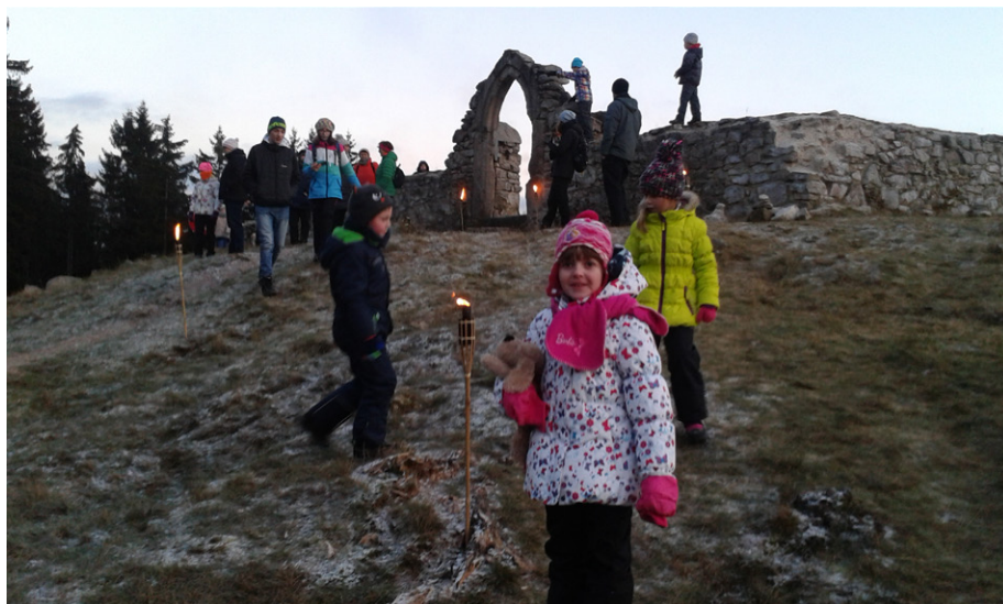
Vzpomínka na 2.12.2017 „U svatého Mikuláše“.