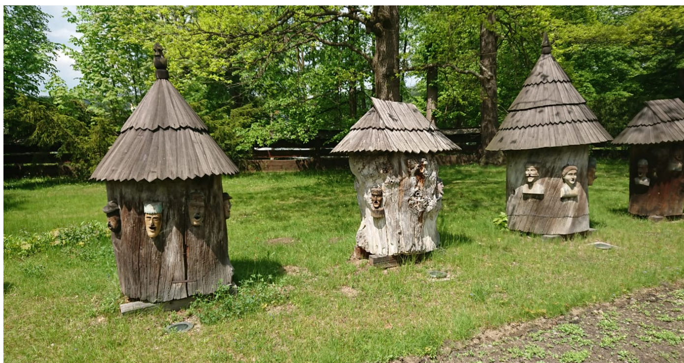
Historické kláty v Rožnovském skansenu